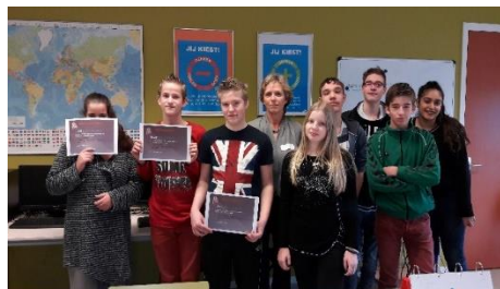
Peer mediators PRO Emmen