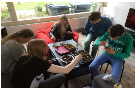
Leerlingen van de O&S1A-klas in het woonhuis in Emmen

Deze groep leerlingen richt zich op wonen, werken en vrije tijd. Hierbij speelt zelfredzaamheid sociaal emotionele ontwikkeling een centrale rol. Deze leerlingen zijn geselecteerd op een aantal punten: IQ, extra benodigde extra ondersteuning op het gebied van zelfredzaamheid, zelfstandigheid en gericht op sociaal emotionele ontwikkeling.