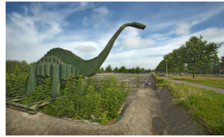
JOPPIE, de houten dino in Emmen

Let op! Bekijk Joppie begin september Dan een uitgebreider verslag met foto's op de website van onze school.